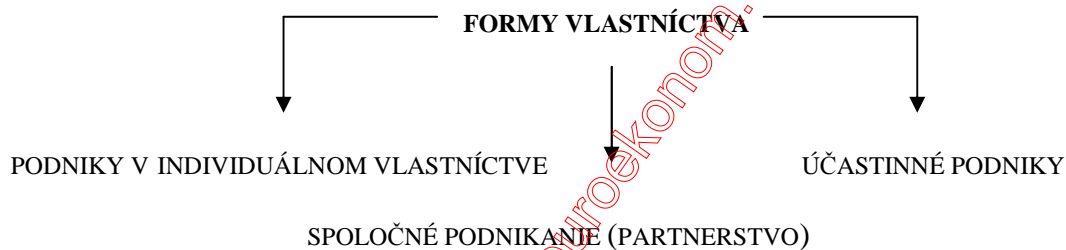
Obrázok 3 Podniky podľa formy vlastníctva

Podniky v individuálnom vlastníctve tvoria prevažnú časť podnikov. Zamestnávajú len málo zamestnancov (obvykle živnostník s rodinnými príslušníkmi). Táto forma má pre malé firmy rad predností – môžu ľahko vzniknúť i zaniknúť, menšia potreba kapitálu, osobná dôchodková daň. Nevýhodou je vyššie riziko, ťažšia dostupnosť ďalších finančných zdrojov. Pri rozvoji a rozširovaní firmy, pri raste obratu a pod. prestáva byť táto forma podnikania výhodnou.